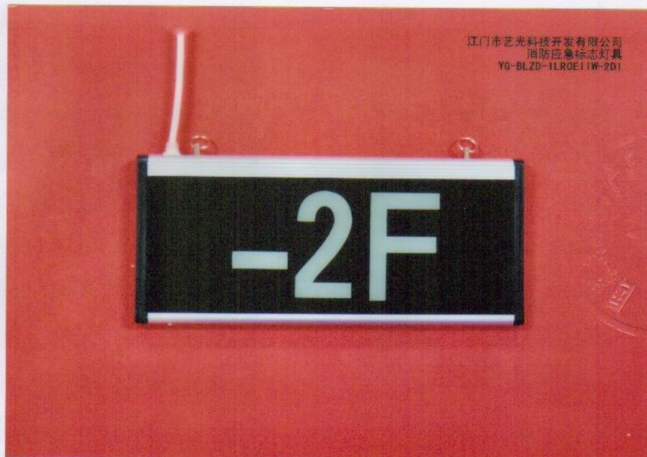
产品型号：YG-BLZD-1LR0E I 1W-2D1（图 B. 6 -2F）