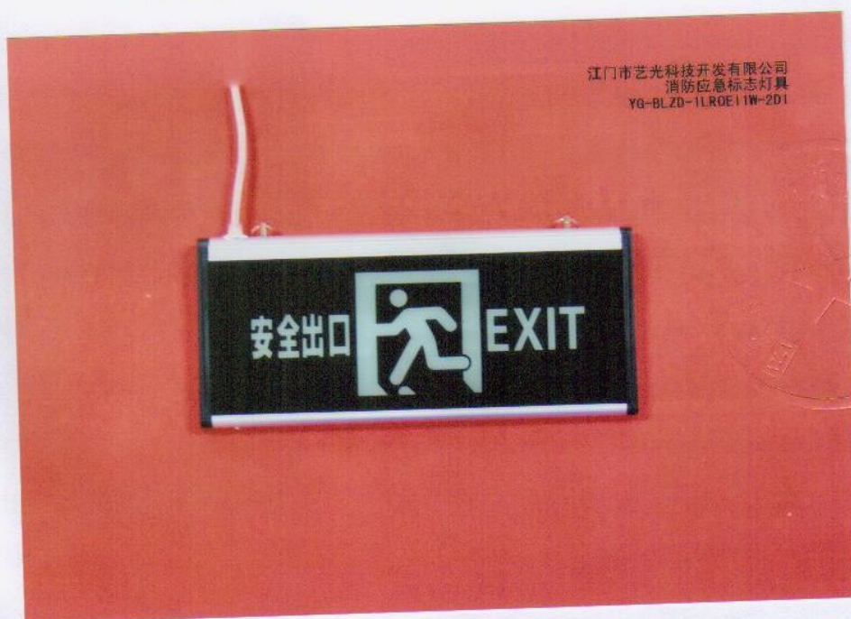
产品型号: YG-BLZD-1LR0E I 1W-2D1 (图 B. 1)