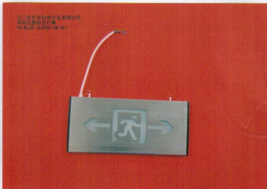
产品型号：YG-BLZD-2LR0E I 1W-2E1（图 B. 4）