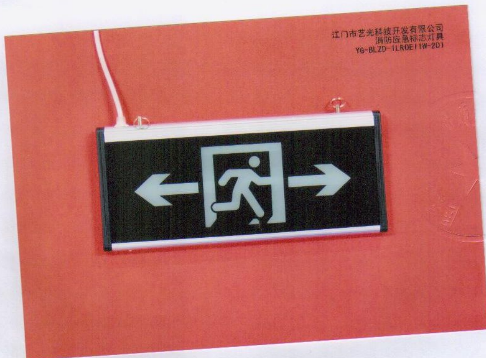
产品型号: YG-BLZD-1LR0E I 1W-2D1 (图 B. 4)