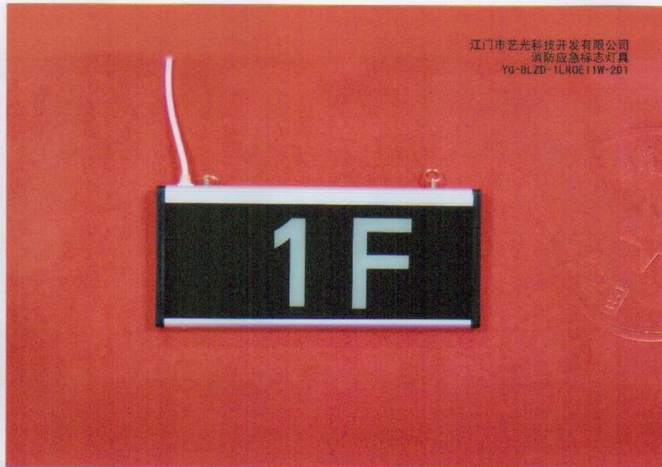
产品型号：YG-BLZD-1LR0E I 1W-2D1（图 B. 6 1F）