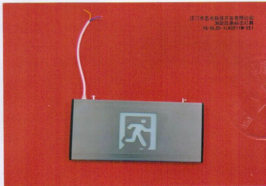
产品型号：YG-BLZD-1LR0E I 1W-2E1（图 B. 2）