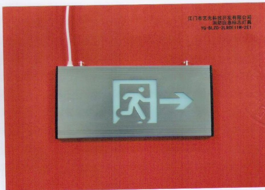
产品型号：YG-BLZD-2LR0E I 1W-2E1（图 B. 2+图 B. 5）