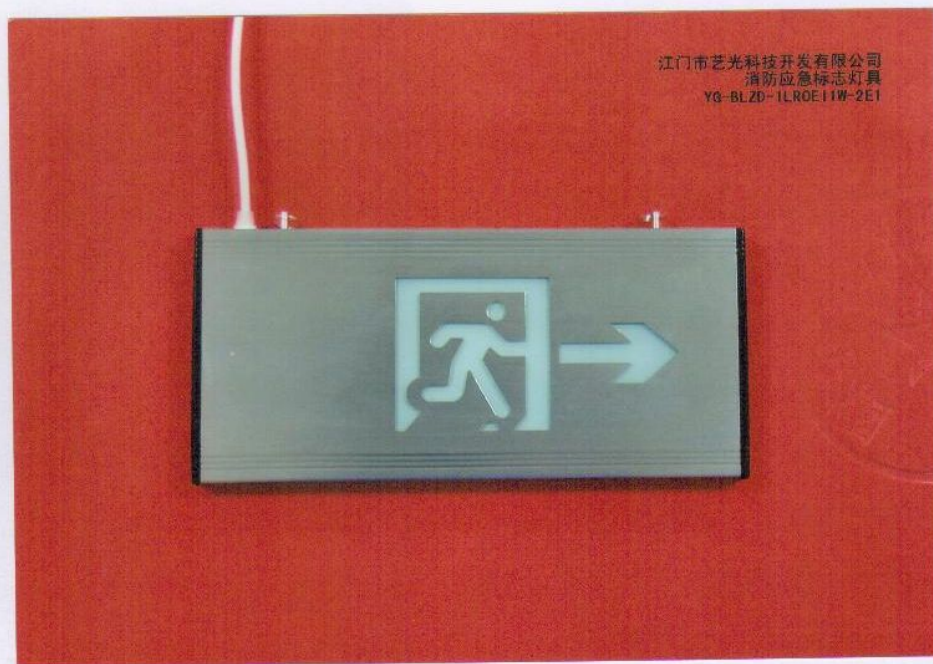
产品型号：YG-BLZD-1LR0E I 1W-2E1（图 B. 2+图 B. 5）