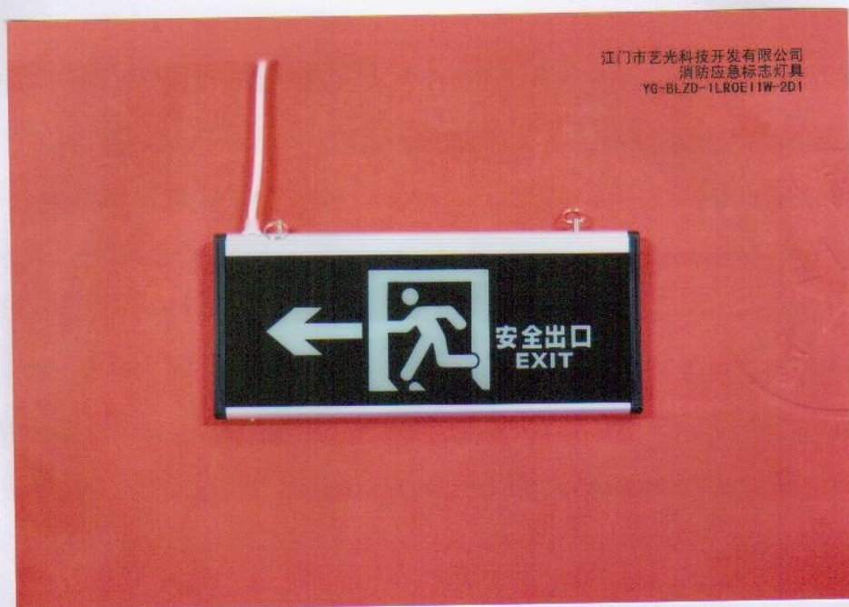
产品型号：YG-BLZD-1LR0E I 1W-2D1（图 B. 1+图 B. 5）