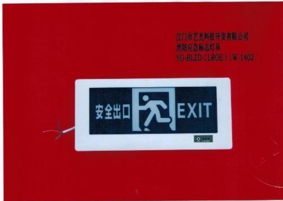
产品型号：YG-BLZD-1LROE | 1W-1402 (图 B. 1)