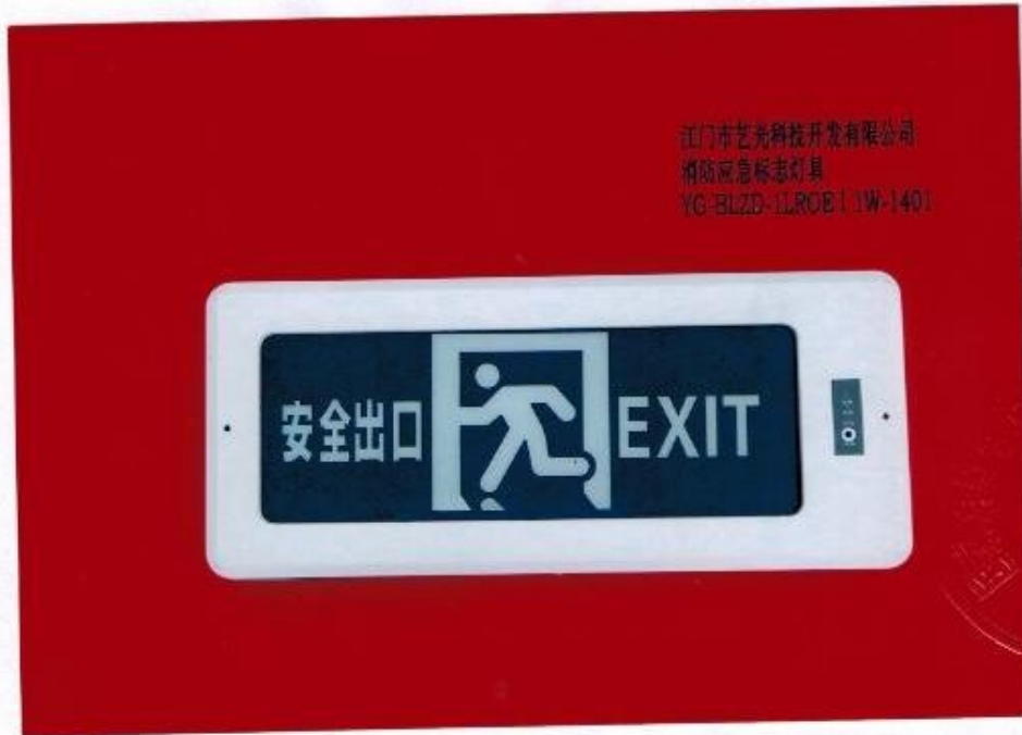
产品型号：YG-BLZD-1LR0E | 1W-1401（图 B. 1）