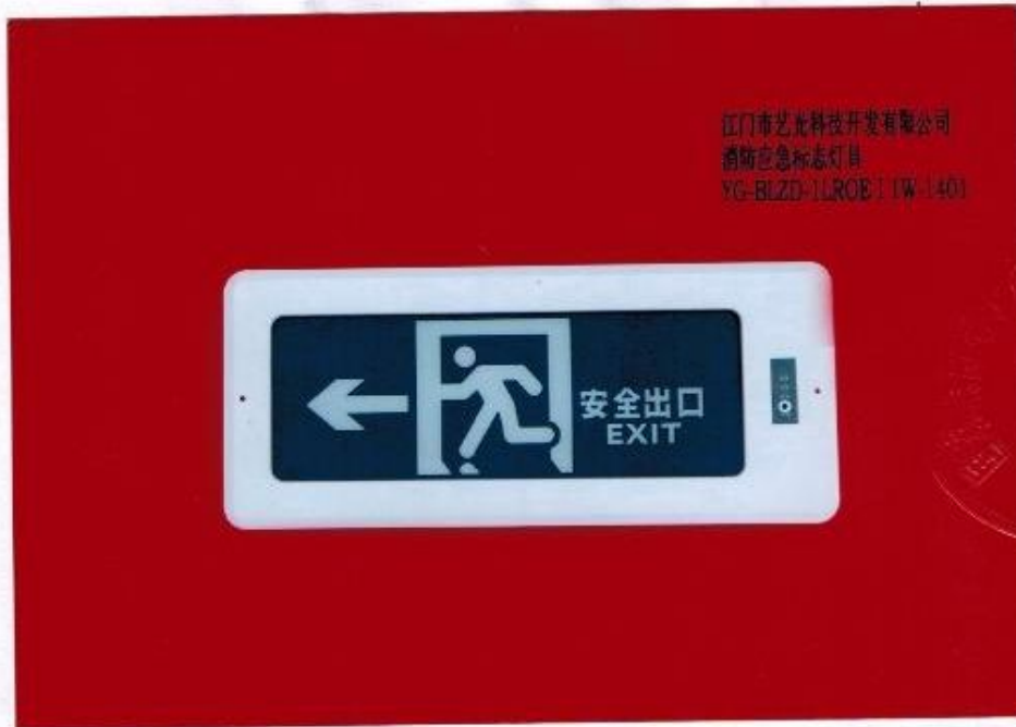
产品型号：YG-BLZD-1LR0E | 1W-1401（图 B. 1+图 B. 5）