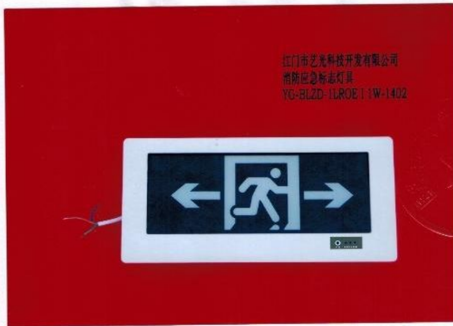
产品型号：YG-BLZD-1LR0E | 1W-1402（图 B. 4）