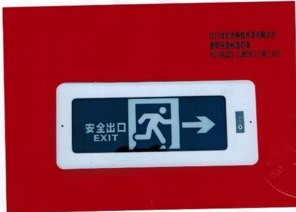
产品型号：YG-BLZD-1LR0E | 1W-1401（图 B. 2+图 B. 5）