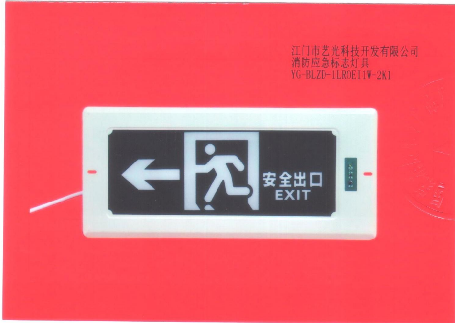
产品型号：YG-BLZD-1LR0E I 1W-2K1（图 B. 1+图 B. 5）