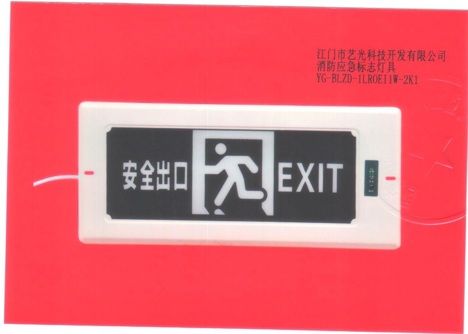
产品型号：YG-BLZD-1LROE I 1W-2K1（图 B. 1）